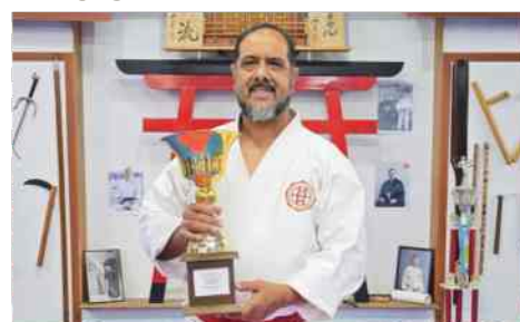
La copa de CNKI que ganamos