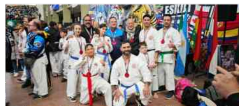
El equipo del Hall of Fame en UIAMA