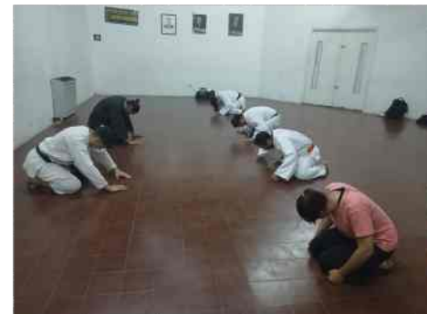
Clase en dojo central